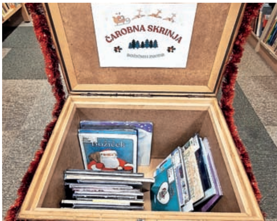
Čarobna skrinja, polna zimskih in božičnih zgodb

Spodbujamo vas tudi, da si na dolg decembrski večer vzamete čas, smuknete pod toplo odejo in si privoščite kakšno dobro knjigo. Če ste brez idej, si lahko pomagata z našim bralnim priporočilom.