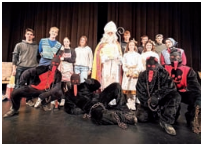
Miklavževanje v Žireh

Na predvečer obdarovanja se je oglasil v žirovski kinodvorani, kjer so vsem zbranim žirovski mladinci najprej predstavili kratko igrico Če ima sv. Miklavž zamudo, ki je želela nagovoriti s sporočilom, da delajmo dobro skozi vse leto, ne le zadnje dni pred Miklavževim prihodom. Dobrotnika so spremljali angelčki in parkeljni, slednji kot opomin za vse tisto, pri čemer se lahko izboljšamo. S seboj je prinesel nebeško knjigo, v kateri so zapisana vsa dobra in srčna dela, kot tudi tisto, kar ni bilo lepo in vredno pohvale. Ker pa je (bil) prepričan, da so otroci v Žireh veliko dobrega naredili, jim je po domovih pustil darove. Da je bilo lažje počakati, je tudi v kinodvorani za vsakega otroka posebej pustil knjižice, kruhove parkeljne, za katere so poskrbeli žirovski skavti, in nekaj sladkarij. Pokazal je navdušenje nad tem, da ima tudi v Žireh toliko pomočnikov in podpornikov: Župnijo Žiri, Občino Žiri, nekatera podjetja in seveda vsakega izmed nas, ki drug drugemu