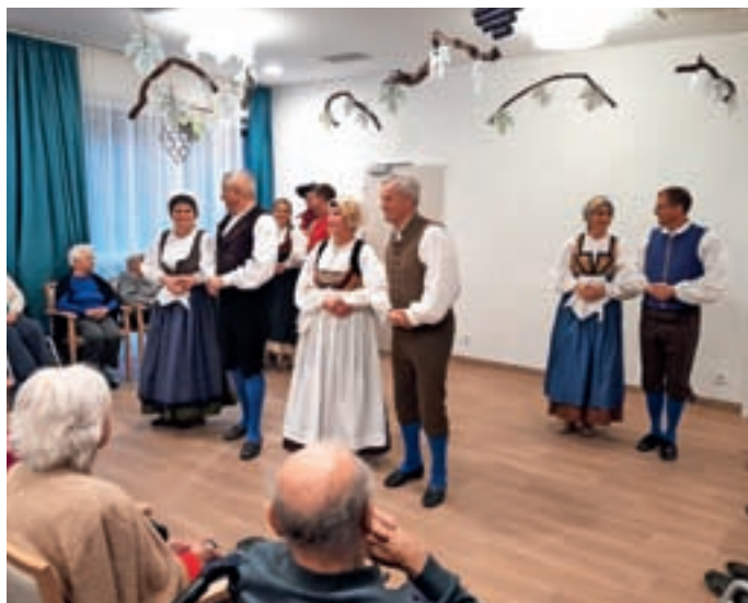
Martinovanje v domu je popestrila folklorna skupina Zala iz Turističnega društva Žirovski vrh.

V novembru seveda ne gre brez martinovanja, ki smo ga organizirali tudi v našem domu. Krstili smo mošt in uživali ob plesu folklorne skupine Zala iz Turističnega društva Žirovski vrh in petju Polanskih deklet. Tudi tokrat ni manjkala harmonika, veseli obrazi, dobra volja in druženje s prijatelji in znanci iz domače in sosednje občine Gorenja vas - Poljane.