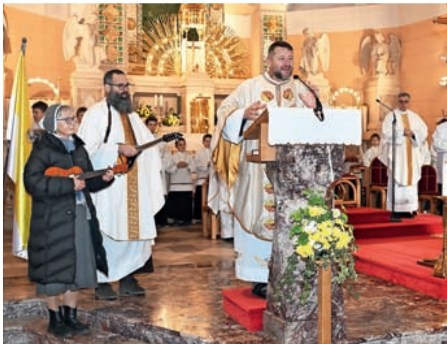
Obnovo misijona sta vodila brata kapucina, pridružila se jima je sestra frančiškanka – Marijina misijonarka.

Podobno kot lani se je tudi med obnovo misijona zvrstilo blizu dvajset dogodkov, kot so jutranji sprehod, jutranje hvalnice,