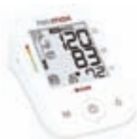
Vrhunski švicarski merilniki krvnega tlaka ROSSMAX